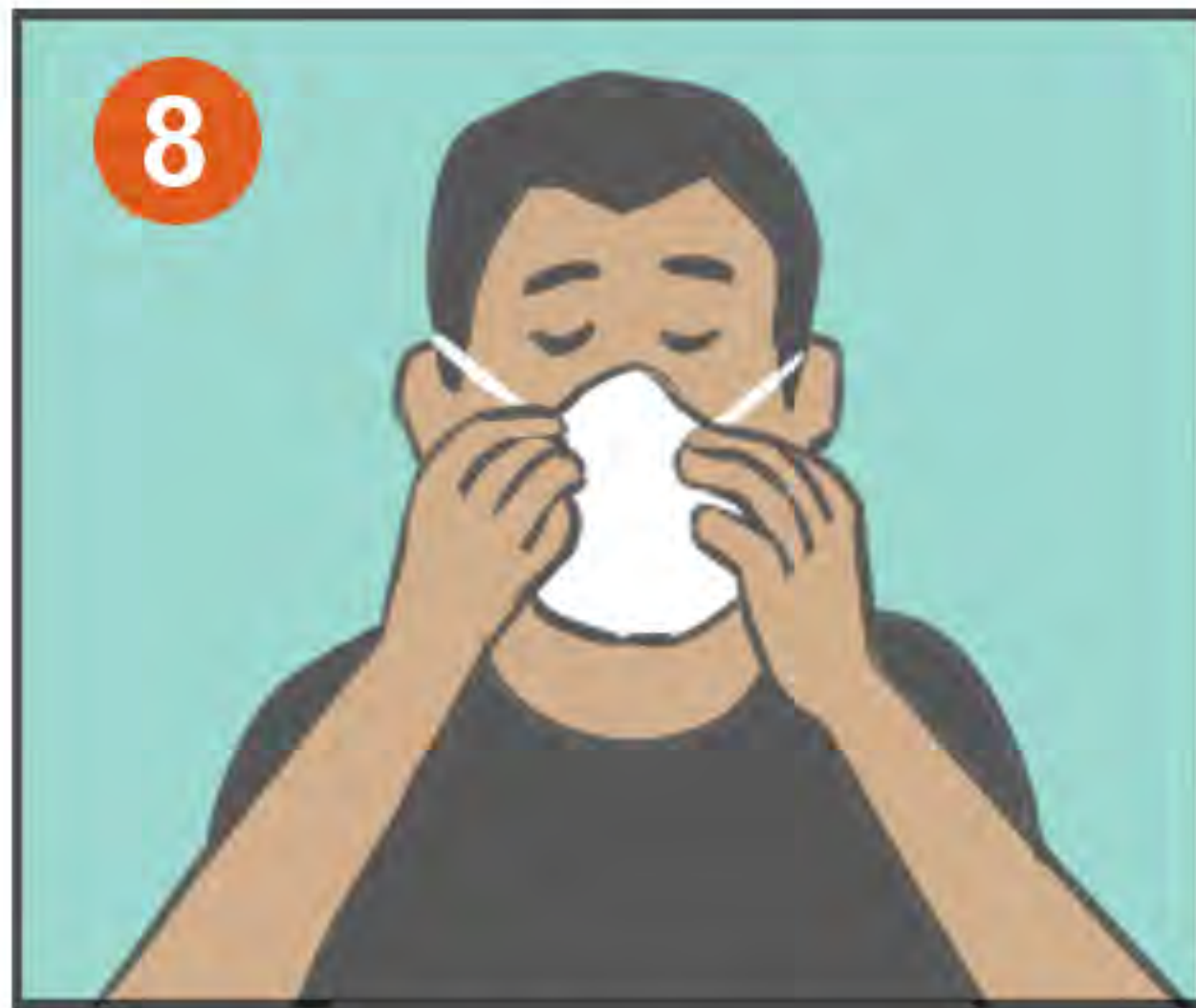
8 ASEGÚRESE QUE ESTÉ BIEN AJUSTADO A SU CARA