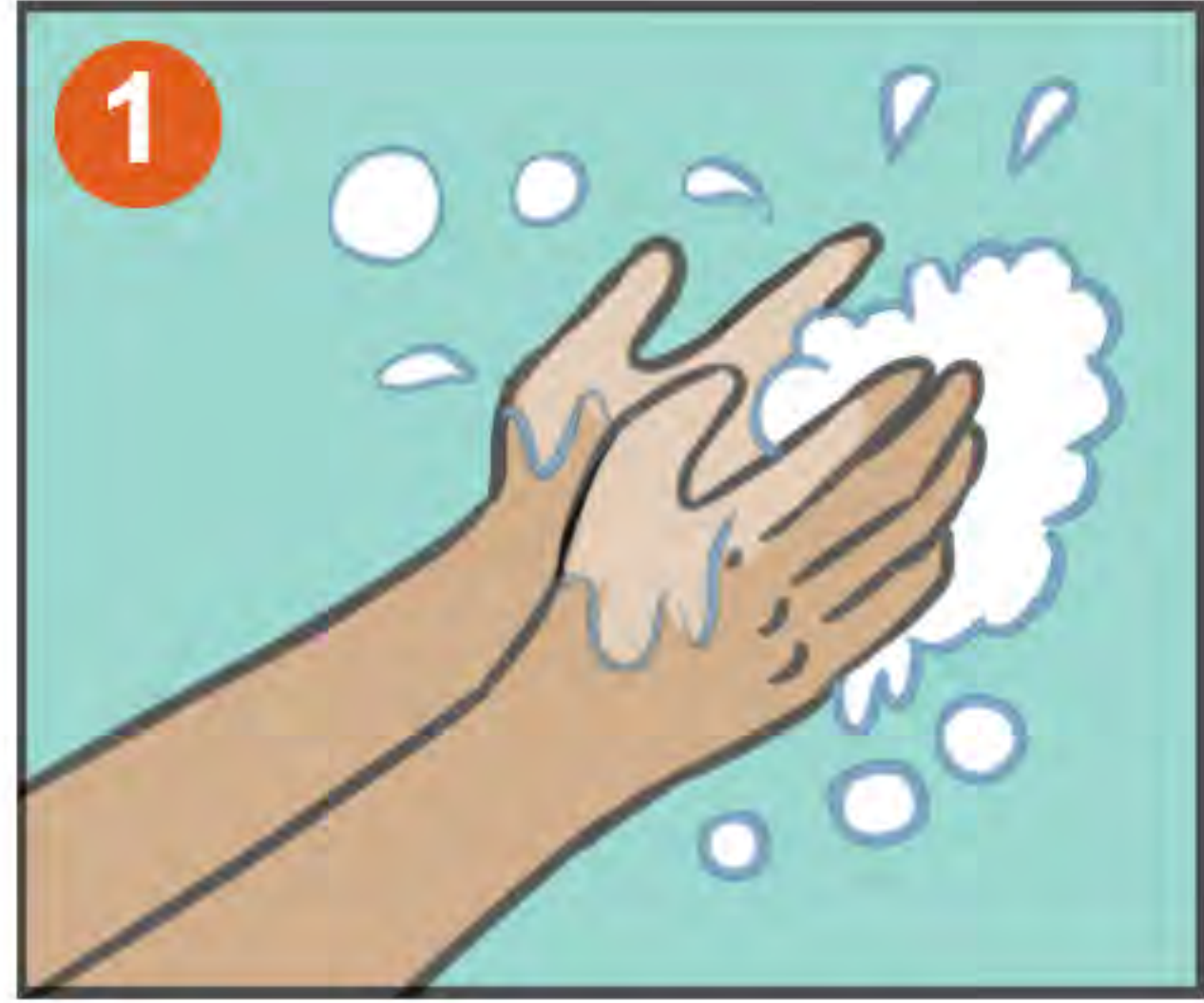
1 LÁVESE LAS MANOS

(NIOSH: Instituto Nacional de Seguridad y Salud Ocupacional)