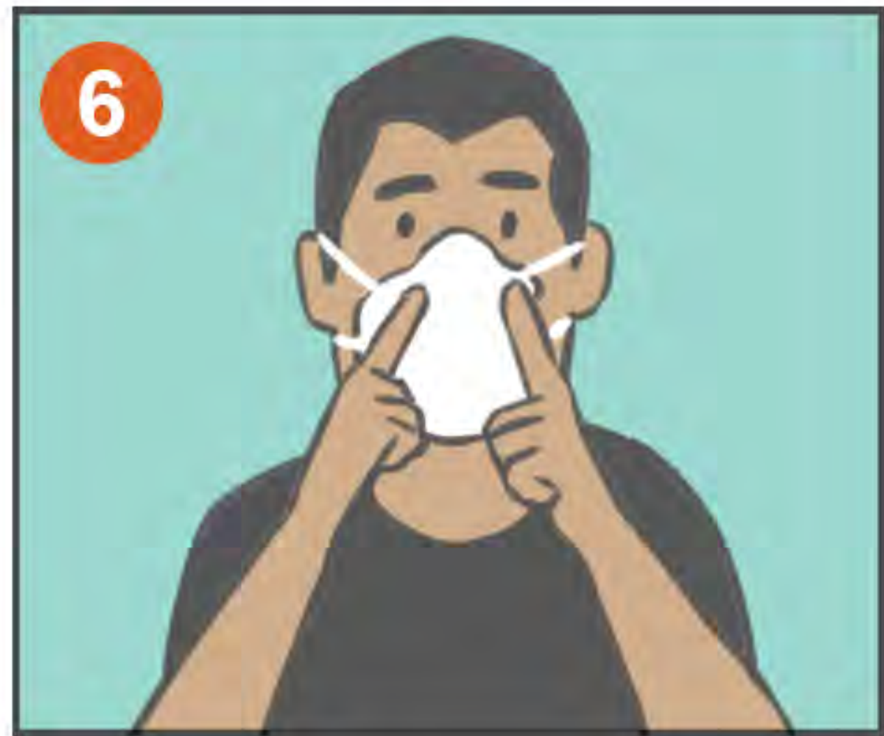
6 MOLDÉELO A SU NARIZ