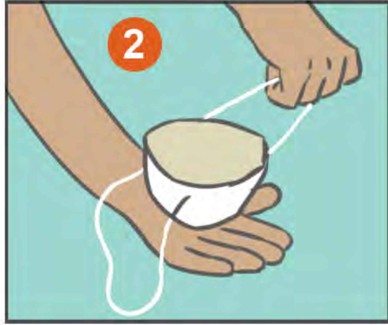
2 REVISE SU RESPIRADOR N95