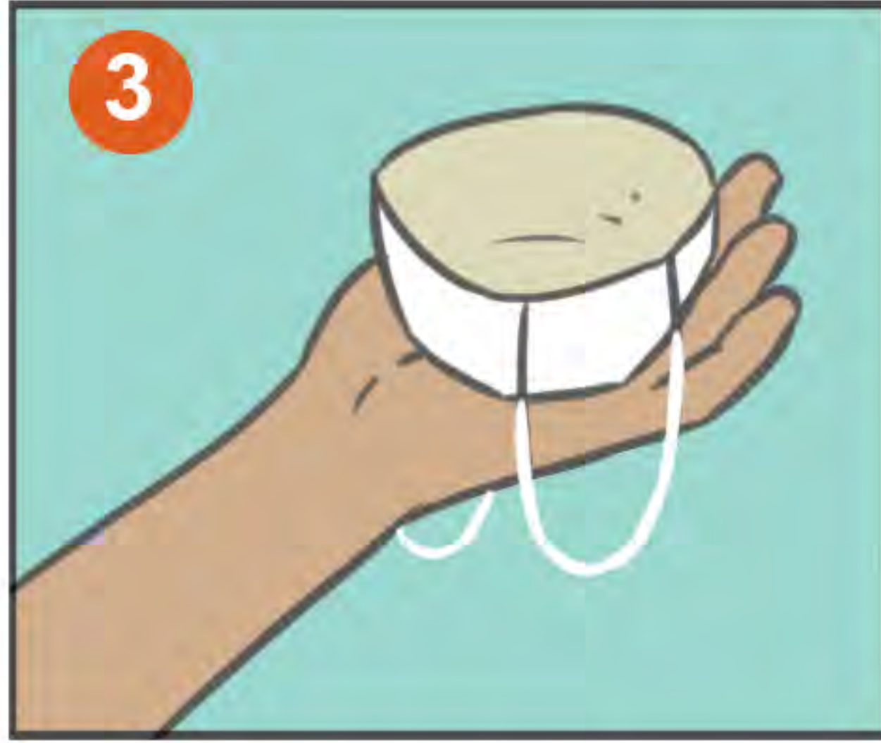
3 COLÓQUELO ASÍ EN SU MANO