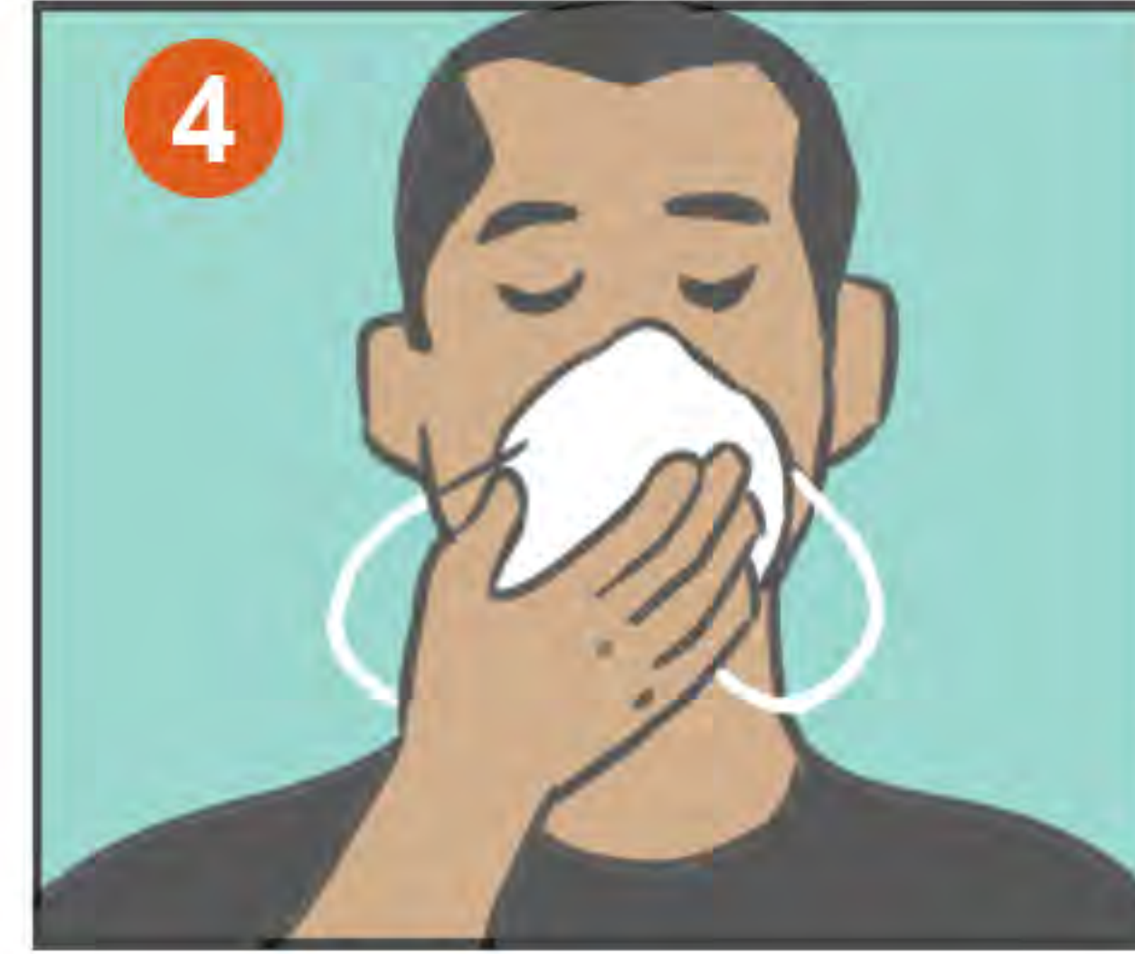
4 COLÓQUELO BIEN EN SU CARA