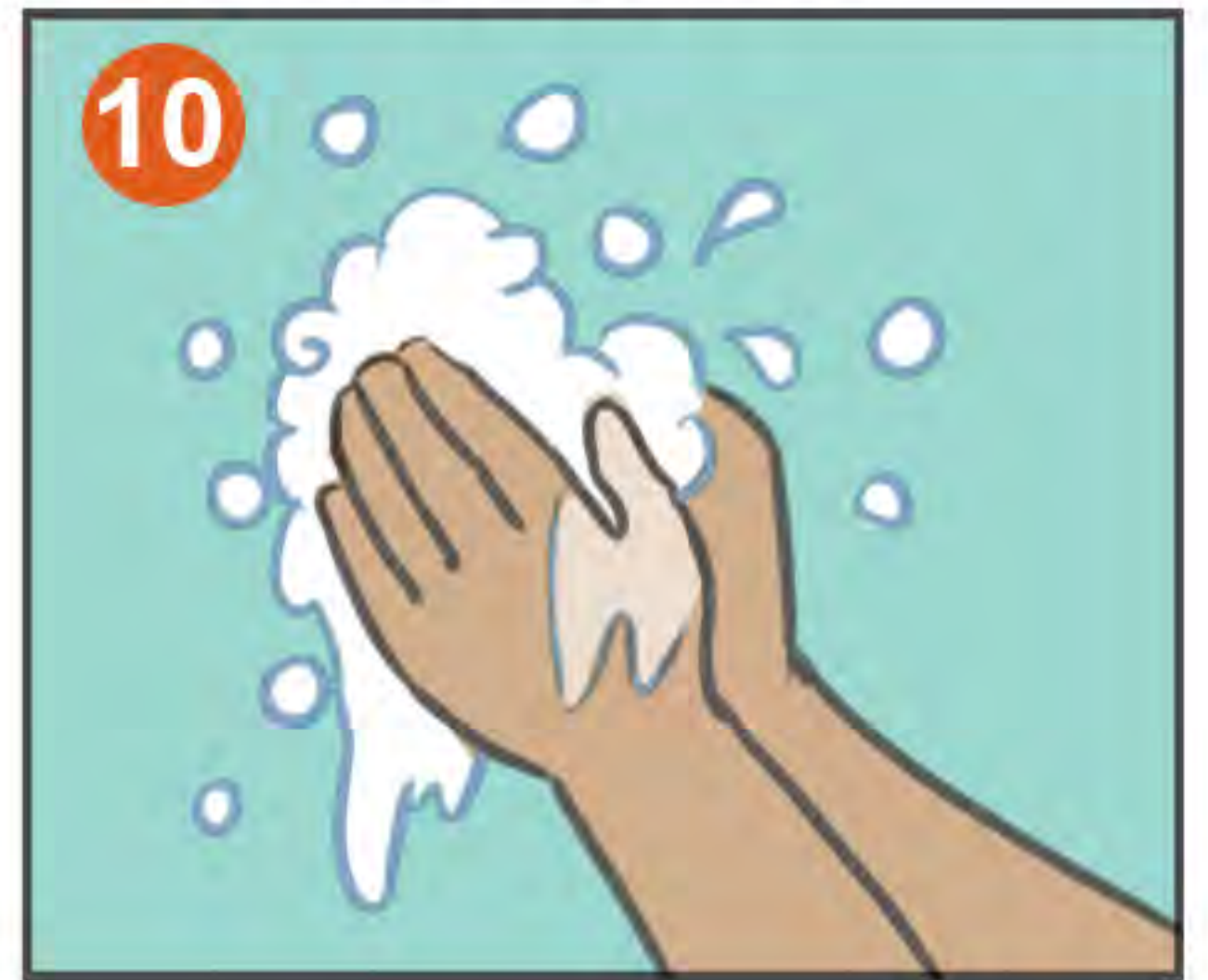
10 LÁVESE LAS MANOS