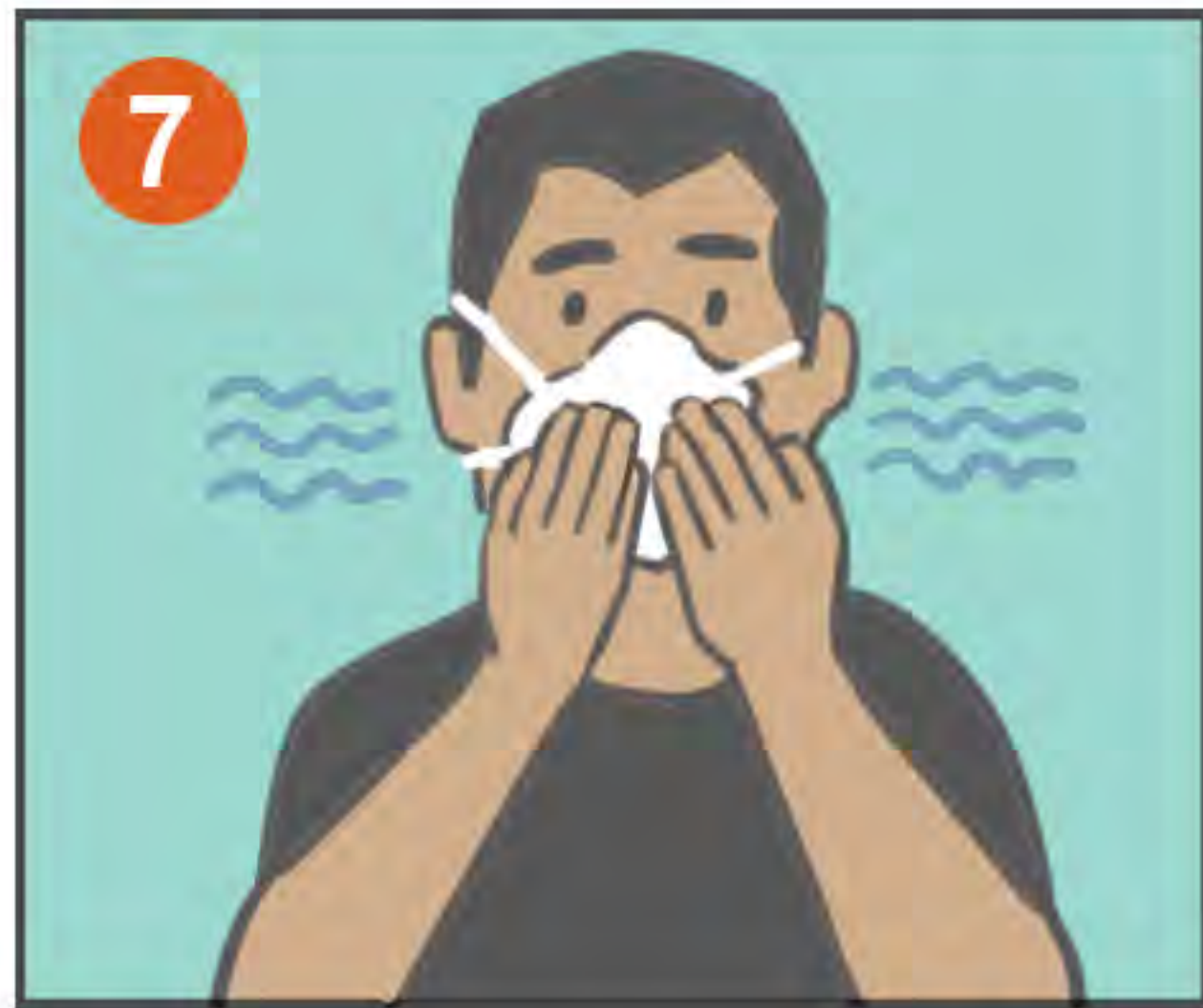
7 REVISE QUE NO ENTRE AIRE NI PARTÍCULAS