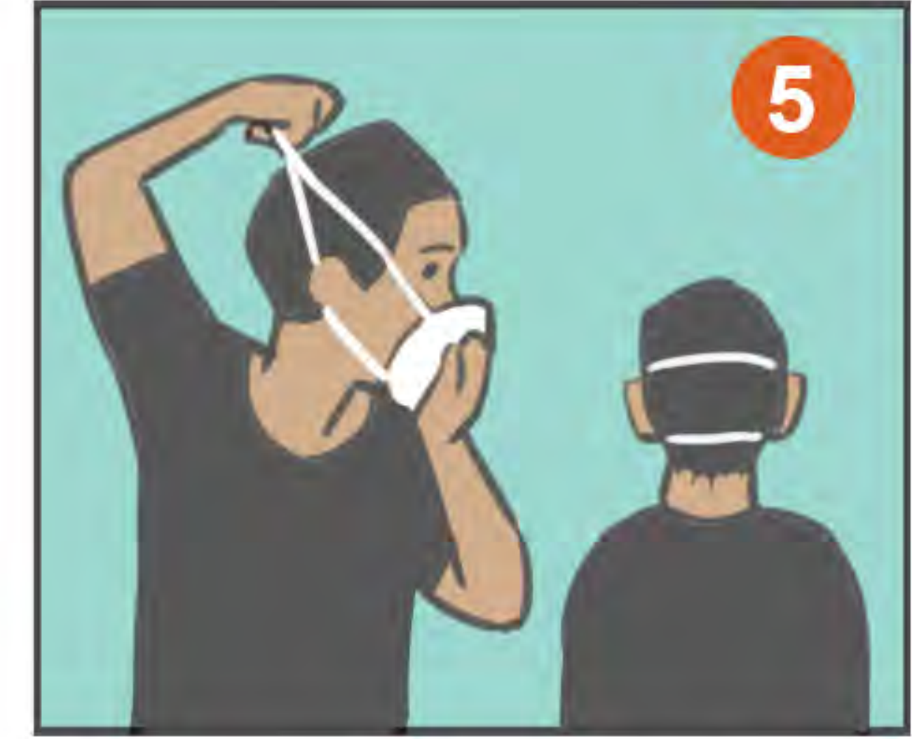
5 ASEGURE LAS CORREAS DE CUELLO Y CABEZA