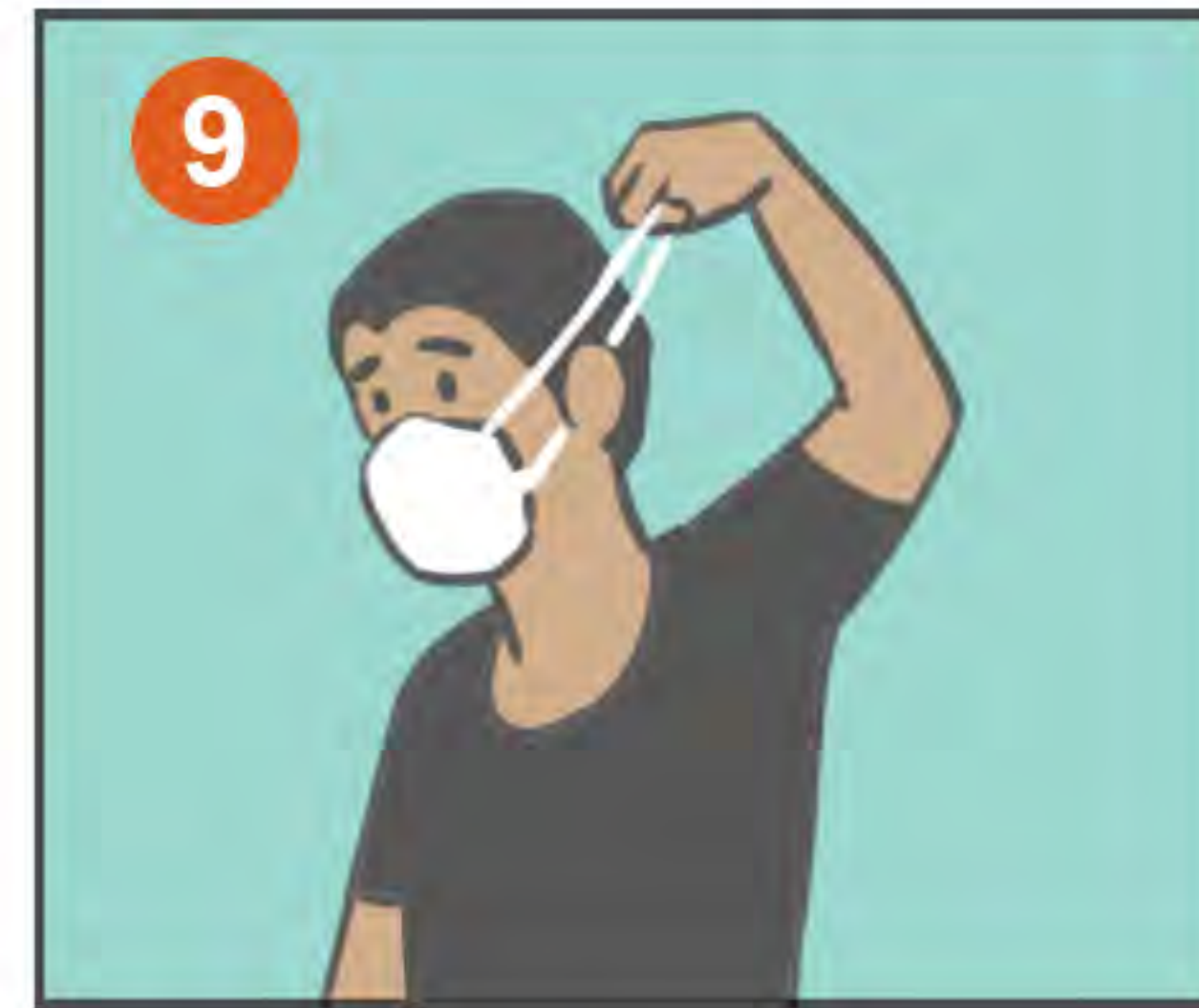
9 QÍTVELO DE ESTA MANERA